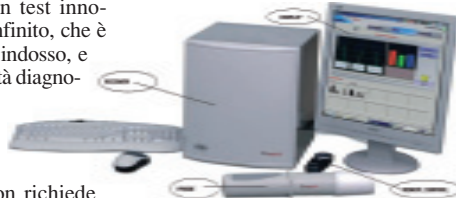
Il complesso del bioscanner Trimprob

la validità. Il Bioscanner ottiene l'omologazione dell'Istituto superiore di sanità. Il Ministero della Salute lo inserisce nel repertorio dei dispositivi medici del Servizio sanitario nazionale. Cinquanta